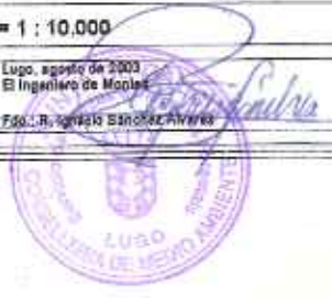
PLANO Nº 1