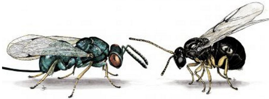
Imaxe de Torymus sinensis (esquerda) e Dryocosmus kuriphilus (dereita)

O programa de acción da Dirección Xeral de Planificación e Ordenación Forestal, para a loita biolóxica contra Dryocosmus kuriphilus , conta con dúas liñas principais de actuación: