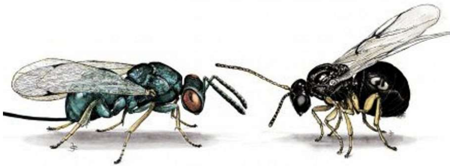
Imaxe de Torymus sinensis (esquerda) e Dryocosmus kuriphilus (dereita)

O programa de acción da Dirección Xeral de Planificación e Ordenación Forestal, para a loita biolóxica contra Dryocosmus kuriphilus , conta con dúas liñas principais de actuación: