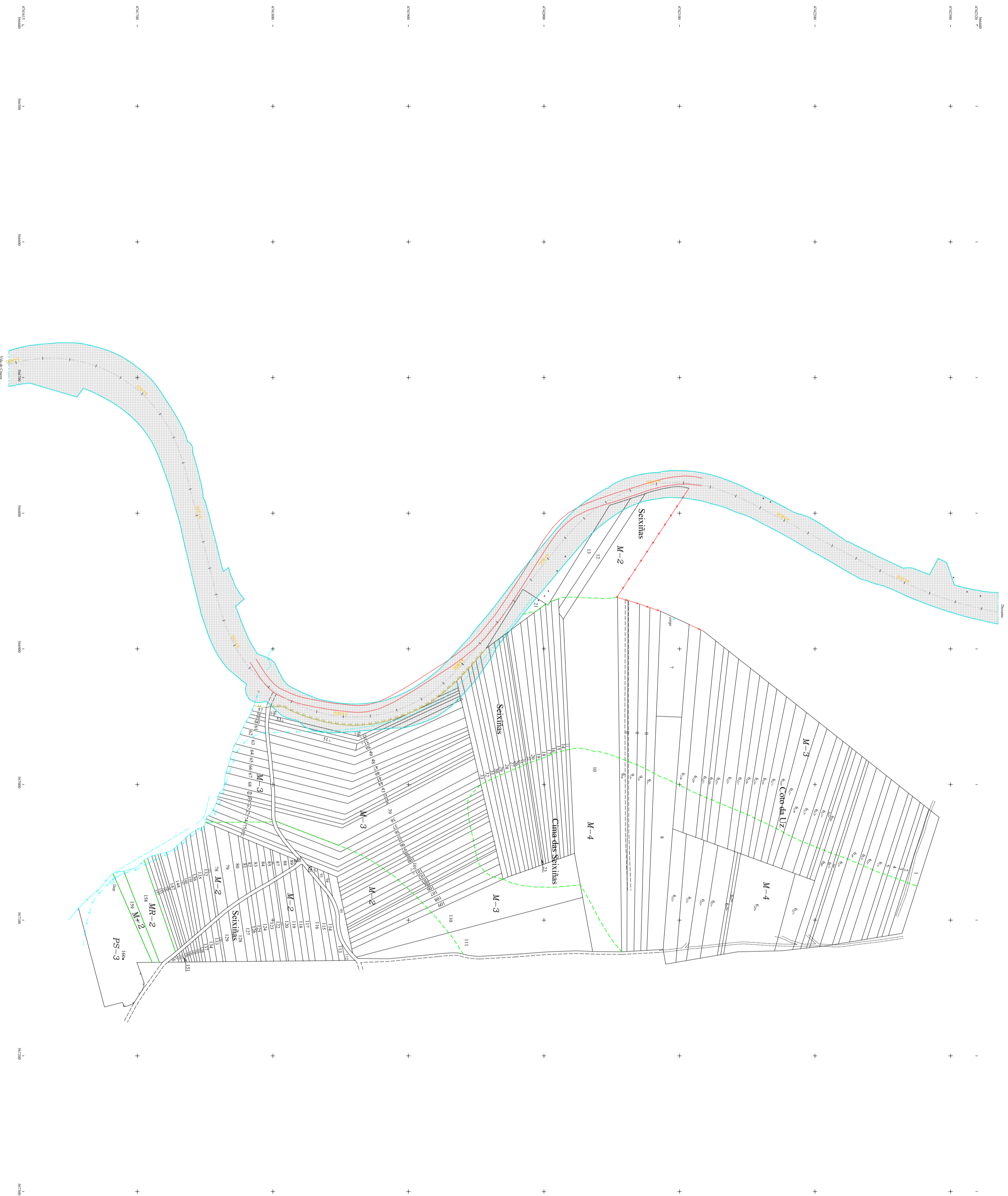
DISTRIBUCIÓ DE POLÍGONOS